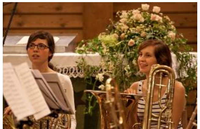
Bild: Das größte und schwerste Instrument, die Tuba, ist bei „Blechimpuls“ in Frauenhand, sowohl auf der CD als auch im Konzert in der Martin-Luther-Kirche am 26.12.2012