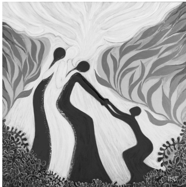
Bild: „Justice“, Hanna Cheriyan Varghese

der nächste Weltgebetstag blickt nach Malaysia. Am 2. März 2012 um 19 Uhr wird er hier im Ulmer Westen begangen. Wir sind in diesem Jahr Gast in der Erlöserkirche an der Römer- straße 85. Frauen aller Konfessionen laden dazu ein.