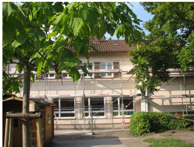
Bild: Der Kindergarten Schillstraße hat einen reizenden Garten (hinter der Gärtnerei Röder), in dem sich nicht nur Kinder wohlfühlen.

„Sagt, wie wunderbar Gott ist!“, lautet sein Thema. Wir treffen uns in diesem Jahr im Kindergarten Schillstraße, weil es dort einen herrlichen Garten gibt, in dem man im Anschluss an die Gottesdienstfeier auch vorzüglich grillen kann. Bitte eigenes Grillgut und Geschirr mitbringen! Wir sorgen für Grillfeuer und Getränke.