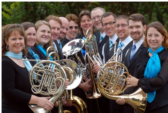
Bild: Sechs Bläserinnen und sechs Bläser an Trompete, Horn und Posaune bilden EUROBRASS.