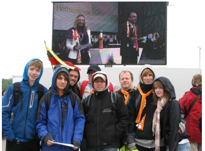
Bild: Völlig verregnet und klitschnass war er, dieser Zweite Ökumenische Kirchentag; kein blau-weißer Himmel über München! Nicht einmal ein Sonnenstrahl beim ökumenischen Schlussgottesdienst, der auf der Theresienwiese am Sonntagmorgen mit über 100.000 Besuchern gefeiert wurde (dort entstand das Foto). Aber trotzdem waren die gemeinsamen Tage stimmungsmäßig sehr gut.