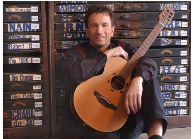
Bild: Clemens Bittlinger (* 1959) gilt als einer der wichtigsten Liedermacher auf dem Gebiet des „Neuen Geistlichen Liedes“. Er schuf beliebte Beiträge u.a. für das „Evangelische Gesangbuch“ und für viele Kirchentage. Bittlinger ist evangelischer Pfarrer und vermittelte der christlichen Populärmusik durch eigene Kompositionen und Konzerte während der vergangenen Jahre wichtige Impulse. Nähere Information: www.clemens-bittlinger.de

Karten für dieses Konzert an der Abendkasse oder über das Gemeindebüro.