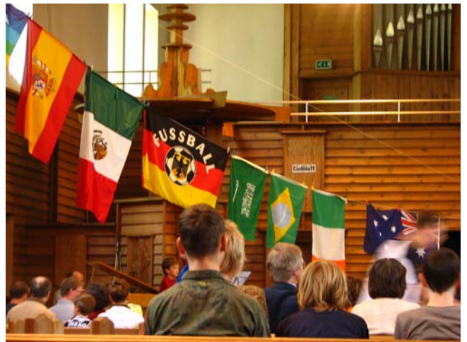
Bild: Bunte Fahnen vieler Teilnehmerländer der Fußball-Weltmeisterschaft 2006 hingen während des ökumenischen Fußballgottesdienstes quer im Kirchenraum der Martin-Luther-Kirche: ein herrliches Bild!

Herzlichen Dank an alle mitwirkenden Mannschaften und an die unterstützenden Fans aus unserer Gemeinde! An eine Neuauflage im nächsten Jahr wird gedacht!