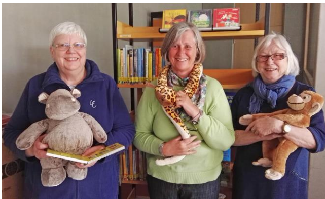
Bild: Mitglieder vom Büchereiteam und -ausschuss, die sich seit Weihnachten engagiert um die Neuausrichtung unserer Kinderbücherei kümmern.

Ab den Sommerferien wollen wir die Öffnungszeiten optimieren. Es wird unter anderem ein Vormittag hinzukommen.