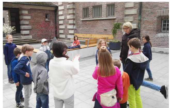
Bild: Die Kinder der KiBiWo Frühling 2016 nutzten auf ihre Weise den herrlichen neu gestalteten Kirchplatz.

Am „Volz-Brunnen“, der wieder plätschert, kann man seit einigen Tagen gemütlich auf Eichenbrettern sitzen; Bäumchen in Kübeln spenden Grün am Wasserquell. Weil der Teil des Platzes jetzt bewusst autofrei gestaltet ist, hat man einerseits herrliche Spielflächen – auch mit Spielgeräten – dazugewonnen, andererseits atmet dieser Zugang Freiheit und Luft. Auf der Terasse stehen jetzt einladend neue Gartentische und -stühle, während eine dreieckige Info-Säule schon vor der Tür über das Gemeindeleben auch Wanderer und Interessierte informiert. Das alles kann am TAG DER OFFENEN TÜR an Christi Himmelfahrt ausprobiert und begutachtet werden.