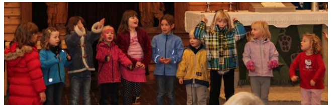
Bild: die Kleinsten der Gemeinde tranken 2013 natürlich noch kein Lutherbier, aber sie sangen – wie die Großen – beim Luthermarkt sehr munter zugunsten des Neubaus.

Mittelalterliche Klänge mit der Musikgruppe Melicus und anderen erfreuten das Herz, während man sich ein leckeres Lutherbier, frischgebackenes Brot aus Seißen und anderes mehr zum Essen schmecken lassen konnte! Viele Gemeindeglieder engagierten sich im Vorfeld, beim Fest halfen noch mehr Hände mit. Ergebnis war ein überaus originelles, fröhliches Fest und ein Erlös von gut 6.000 Euro für unser Bauprojekt.