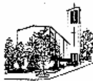
Paul-Gerhardt-Kirche 1957 - 2007