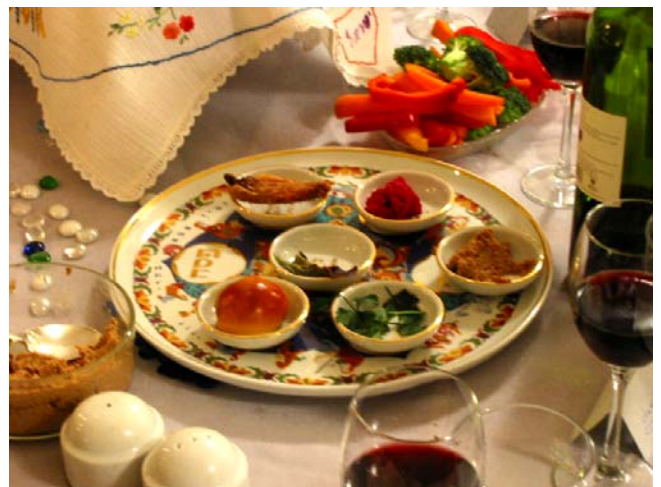
Bild: Der Sederteller, gefüllt unter anderem mit Lammfleisch (in der Martin-Luther-Kirche von der Schwäbischen Alb), bitteren Kräutern, Gemüse, Mazzen, und daneben vier Gläser Rotwein. So ähnlich können Christen sich das Abendmahl Jesu am ersten Gründonnerstag der Geschichte vorstellen; und so wird der Gründonnerstag seit 22 Jahren in der Martin-Luther-Kirche gefeiert.