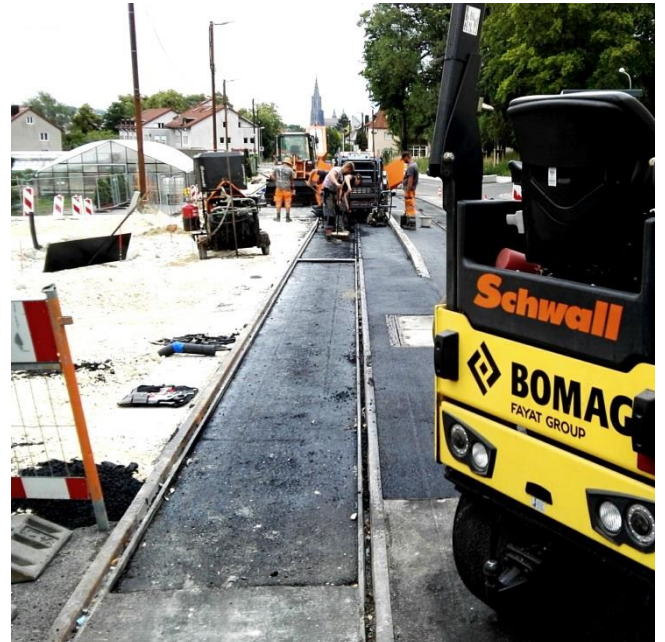
Bild: Baustellen wie hier in der Römerstraße am mittleren Kuhberg prägen zur Zeit überall in Ulm das Gesamtbild der Stadt. Darauf gehen die Theologinnen und Theologen der diesjährigen Sommerpredigtreihe ein.

Baustellen verfolgen meinen Dienst hier in Ulm fast magisch: 2007 wurde aus der Paul-Gerhardt-Kirche eine große Baustelle, 2008 wurde die Orgelempore der Martin-Luther-Kirche für zwei Jahre zur Baustelle, die Orgel mit ihren 3000 Pfeifen wurde bis 2010 generalsaniert. 2013 dann der Abbruch des maroden Martin-Luther-Gemeindehauses, 2014 der Aushub und Neubau des modernen Gemeindehauses, bis 2015 die komplexe Sanierung der Westfassade an der Kirche und zum Jahresende Einweihung der gesamten Baumaßnahme. Zuletzt ab 2016 der aufwändige Gleisbau einer neuen Straßenbahnhaltestelle mit dem Namen „Martin-Luther-Kirche“, die wir im Advent 2018 zusammen mit dem Verkehrsbetrieb der Stadt Ulm feierlich einweihen dürfen.