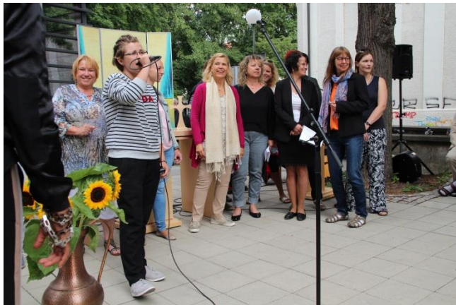
Bilder: ein vorzügliches Plätzchen für Freiluft- und Open Air Gottesdienste war im Sommer 2018 der neugestaltete Platz zwischen MaLuKi und Gemeindehaus. Hier „GOSPEL IM WESTEN“, der Chor rund um SIYOU. Und auch den beiden Gemeindepfarrern macht das Singen im Freien sichtlich Freude.

IBAN: DE 62 6305 0000 0021 0516 36 www.orgelfreundeulm.de