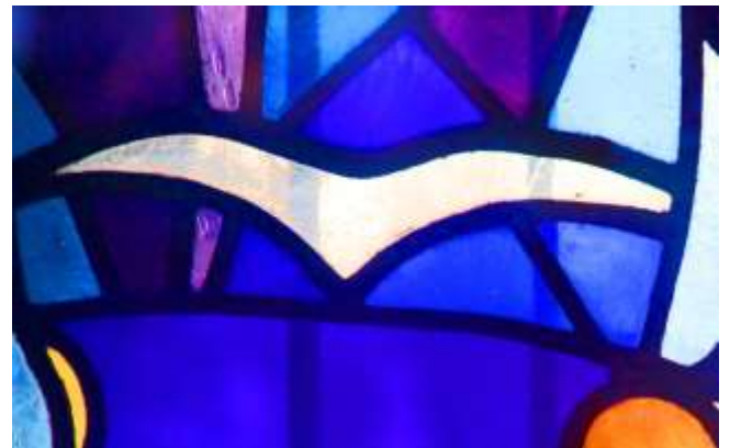
Bild: Neben dem Haupteingang der Martin-Luther-Kirche wurde 1928 ein unscheinbares Fensterchen eingesetzt: eine weiße Taube des Friedens schwebt im Farbglas. Tiefblaues, wertvolles Cobaltglas umgibt den fast durchsichtigen und zerbrechlichen Vogel, der seine Schwingen ausgebreitet hat.

Dass man dem Frieden, dem Schalom, aber nachjagen soll, klingt fast schon beunruhigend. Frieden braucht offenbar gelegentlich auch die Anspannung und Konzentration einer Jagd, auch die Entschlossenheit und Energie eines Jägers, damit er am Ende wahr wird und zur Geltung kommt.