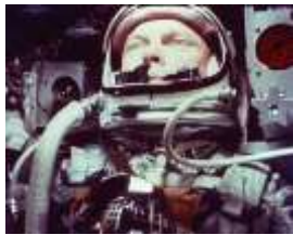
Bild: Hochbegabte Mathematikerinnen brachten einen US-Astronauten im Weltall durch ihre Berechnungen in die richtige Umlaufbahn. Um verschwiegene, aber wahre Begebenheiten geht es im nächsten Offenen Filmabend im Gemeindehaus.

Wolfgang Siegl schreibt: Als Film für den letzten Donnerstag im Februar habe ich „Hidden Figures“, einen Film von Theodore Melfi aus dem Jahr 2016 ausgewählt, der die vom nicht gewürdigten, zentral wichtigen Beitrag Dreier Mathematikerinnen berichtet, von ihrer Beharrlichkeit und Würde im Angesicht der doppelten Diskriminierung, mit der sie als schwarze Frauen konfrontiert waren.