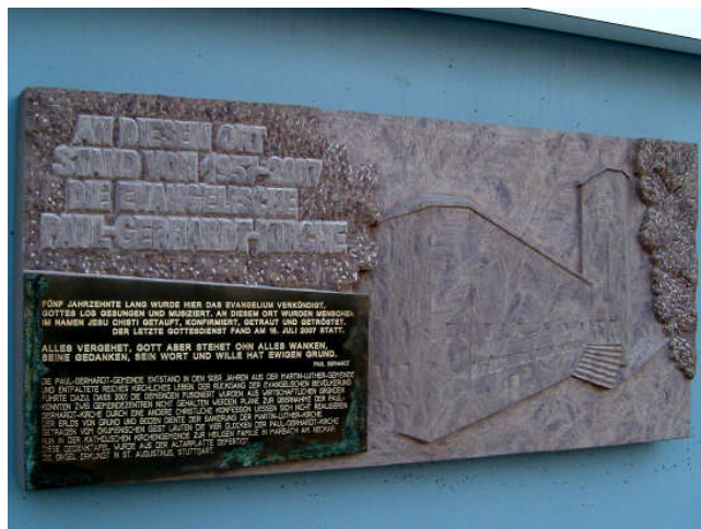
Bild: Die neue Gedenkplatte für die Paul-Gerhardt-Kirche an der Ecke Warndtstraße / Neunkirchenweg

Stein ist ein Symbol für Unvergänglichkeit, für das, was bleibt - auch in der Bibel. Jakob richtet ein Steinmal auf und begründet damit das Heiligtum von Bethel. Die Zehn Gebote sind in Steintafeln eingraviert. Jesus spricht vom klugen Mann, der sein Haus auf Fels baut.