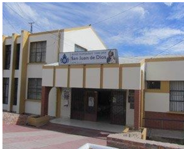
Bild: Das Projekt Instituto Psicopedagogico Ciudad Joven „San Juan de Dios“ wurde 1979 von einem Team aus Ärzten und Krankenschwestern gegründet, mit dem Ziel, Eltern und ihre Kinder in schwierigen Lebenssituationen zu unterstützen.

Der Eintritt ist frei, das Konzert ist zugunsten des humanitären Projektes Instituto Psicopedagogico Ciudad Joven „San Juan de Dios“ in Bolivien!