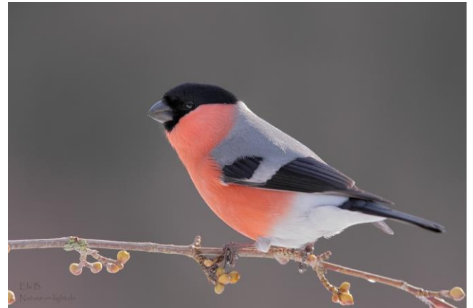
Bild: Gottesdienstlich fast perfekt gekleidet ist der Dompfaff mit seinem eindrücklichen Federkleid, ein zwischen Kuhberg und Galgenberg weit verbreiteter Vogel.

Montag, 14.03., 14.45 Uhr | Rupert-Mayer-Haus, Neunkirchenweg 63, Kuhberg, veranstaltet von der Martin-Luther-Gemeinde und der Heilig-Geist-Gemeinde „Vögel in Stadt und Land“