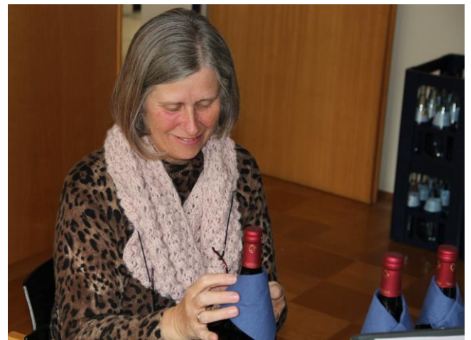
Bild: Der Passah-Wein wird sorgfältig drappiert und für die festliche Mahlfeier vorbereitet.

Eine christliche Form des Passahfestes werden wir am Gründonnerstagabend, 24. März, um 19 Uhr im Paul-Gerhardt- Saal feiern. Diese besondere Mahlfeier – mit langer Tradition in der Gemeinde – wird mit symbolischen Speisen und Getränken zubereitet: Lammfleisch, Gemüse und symbolische Speisen bilden eine Brücke zum ersten Abendmahl, das Jesus einst mit seinen Jüngern feierte.