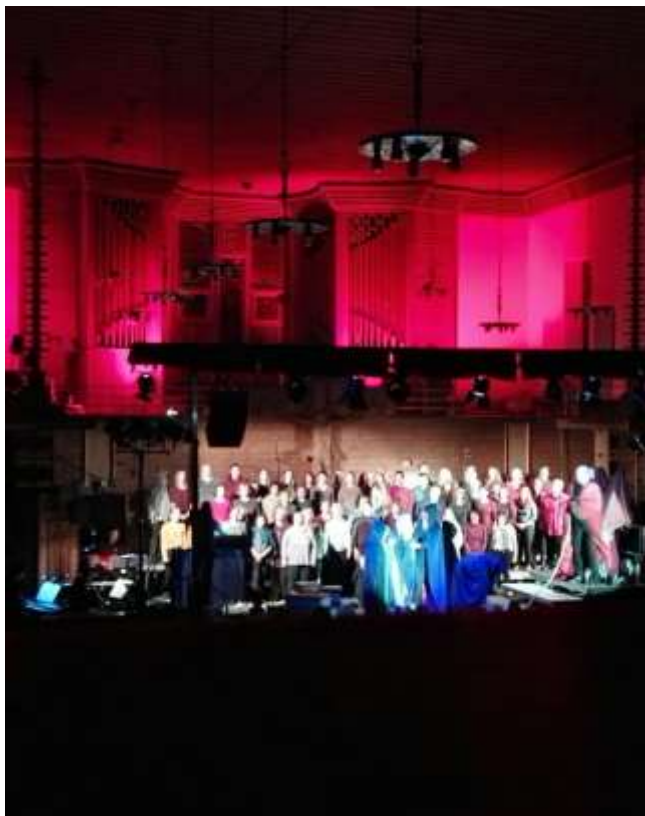
Leuchtend rot glühte die Orgelempore der Martin-Luther-Kirche beim Musical „LUTHER“ Ende Oktober, während der Reformator unten auf der Bühne vor dem Reichstag zitterte.

IBAN: DE 62 6305 0000 0021 0516 36 www.orgelfreundeulm.de