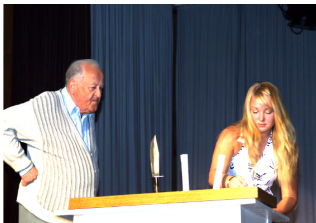
Bild: einer der ältesten Überraschungsgäste beim letzten Galaabend in der MLK mit einer jugendlichen Sketchpartnerin

Am Samstag, 09. Oktober findet im Paul-Gerhardt-Saal der Martin-Luther-Kirche Ulm ab 19.30 Uhr der 21. Gala-Abend der Nachwuchskünstler aus der Region Ulm/Neu-Ulm statt.