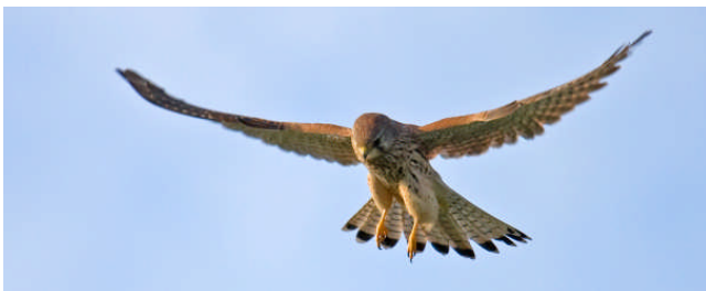
Bild: Auch an der Martin-Luther-Kirche oft gesehen, der sportliche Turmfalke, der gerne auf dem Westtürmchen unseres Gotteshauses „vespert“. Mahlzeit!

Der Igel ist ständiger Gast. An den verblühten Samen einzelner Disteln kann man durchziehende Distelfinken und Bergfinken sehen.