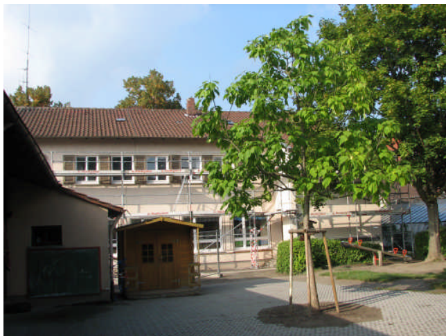
Bild: Der große Garten beim Kindergarten in der Schillstraße lädt nicht nur zum Spielen ein, sondern am 3. Juli auch zum Krabbelgottesdienst, bei jedem Wetter. Die Baumaßnahmen unserer beiden Kindergärten sind übrigens alle abgeschlossen.