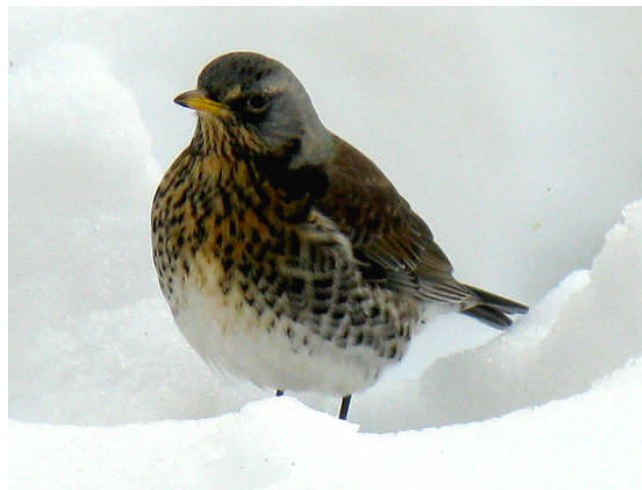
Bild: eine Wacholderdrossel mit ihrem gefleckten Brustkleid

Die MaLuKi eine Oase? - Manche empfinden das so: da kommen Pilger vorbei und finden eine offene Tür, da sitzt ab und an jemand drinnen und braucht an einem der verkehrsreichsten Plätze Ulms, eine Oase der Ruhe und Besinnung. Staubig und laut ist es um die Kirche herum und trotzdem ist das Ensemble, auch noch in anderer Hinsicht, eine kleine Oase. Ringsherum gibt es Nischen und Refugien, die von Fauna und Flora genutzt werden. Die Brennnessel wird nur leicht zurückgedrängt, wenn sie den „Tränenden Herzen“ und dem „Frauenmantel“ zu sehr auf Blätter rücken. Unter der einst wild aufgegangenen Eibe wächst zuverlässig die vielblütige Weißwurz, etwas weiter die Knoblauchrauke und in der Ecke, wo man gelegentlich auf einen Geo-Catcher trifft, gedeiht die Felsenbirne. Hier auf der Nordseite brüten neben der Amsel auch der Haus-Rotschwanz und der quirlige Fliegenschnäpper.