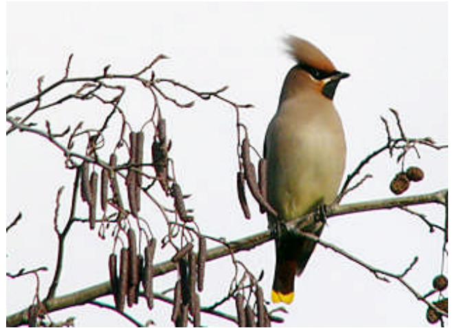
Bild: Seidenschwänze sind filigrane Geschöpfe mit hübschem Irokesenschnitt!

Manchmal allerdings stieben alle Gefiederten davon, dann jagt der Sperber oder Turmfalke in schnellen Jagdflügen durch, um, falls er Beute macht, diese auf unserem Schornstein, dem kleinen Westtürmchen zu verspeisen.