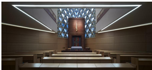
Bild: Der Toraschrein, der der östlichen Himmelsrichtung entsprechend von Ulm nach Jerusalem grüßt.