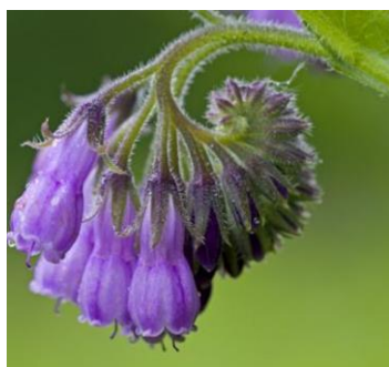
Bild: Blau blüht das „Beinwell“ in Ulm dicht neben den Wellen der blauen Donau!