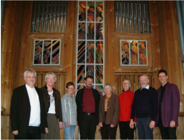
Bild: Der Orgelausschuss (hier ein Bild von 2008) ist glücklich, dass das Projekt nicht nur technisch und musikalisch, sondern jetzt auch finanziell gut bewältigt wurde.

Nach jahrelangen Mühen ist ein eindrückliches Gemeinschaftswerk so gut wie vollbracht: die große Walcker-Organ erfreut uns mit ihrem herrlichem Klang und ihren großartigen Möglichkeiten, die Orgelempore erstrahlt frisch renoviert. Alle miteinander dürfen wir froh und den Menschen, aber auch Gott dankbar sein! Sowohl in der Sitzung des Kirchengemeinderates und als auch in der Zusammenkunft des Orgelvereins-Vorstandes konnte nun die Schlussabrechnung vorgelegt und beraten werden, die wir auch Ihnen als SpenderInnen bekannt machen wollen.