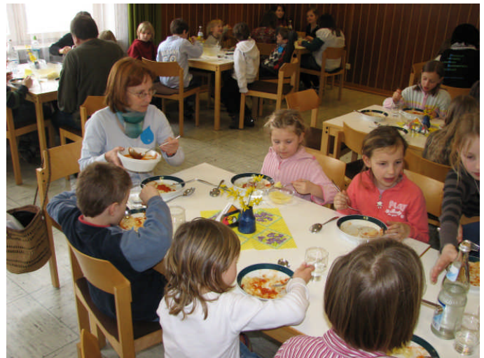
Bild: Gemeinsam schmeckt es ganz besonders gut! Kinder bei der KiBiWo im Gemeindehaus.

Es ist wieder soweit, Kinderbibelwochenende im Herbst! Das heißt Spielen, Basteln, Singen, zusammen Essen und ganz einfach Spaß haben. Im Frühjahr konnten gar nicht alle Kinder mitmachen, da es zu viele waren, deshalb mein Tipp: Meldet euch schnell an, denn das dürft ihr euch nicht entgehen lassen, es heißt nicht umsonst: KIBIWO MACHT KINDER FROH!