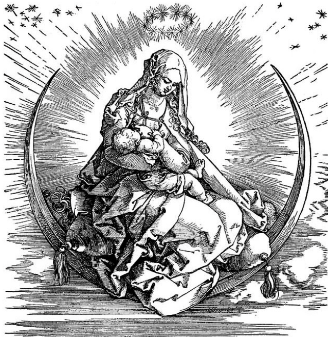
Bild: Stern und der Mond mit seiner Sichel trägt die apokalyptische Frau mit dem Kind – Holzschnitt von Albrecht Dürer