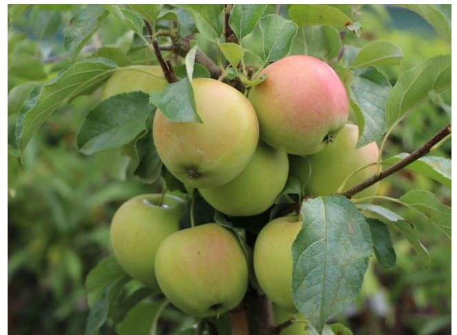
Bild: Sieben Äpfel am Baum kurz vor der Ernte am Kuhberg

Do, 05.11.20 "Mensch, im Apfel liegt dein Glück"