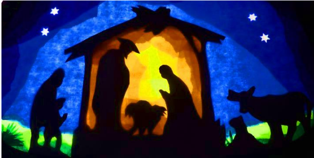
Bild: Scherenschnitt aus Tonpapier und farbiger Transparentfolie in unserem Kindergarten.

Wir machen uns gemeinsam auf die Reise und werden erleben, wie uns Sonntag für Sonntag das Wunder von Weihnachten ein Stückchen näherkommt.